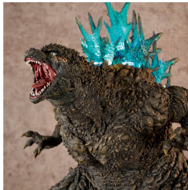
UA Monsters ゴジラ(2023)銀座強襲時イメーカラーVer. UA Monsters GODZILLA (2023) Image Color of Attacking Ginza Ver.