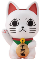
オルカティック ソフビコレクション TVアニメ『ダンダダン』 ターボババ(招き猫) Occultic Sofubi collection TV Anime “DAN DA DAN” Turbo Granny (Fortune Cat)