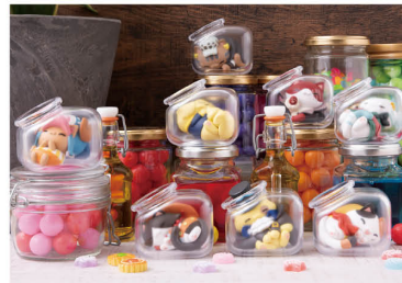
MEGA CAT PROJECT ワンピース おやすみニャンピースニャン!編 MEGA CAT PROJECT ONE PIECE Good Night NyanPieceNyan!