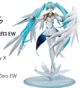
Lucrea 機動戦士ガンダム 45周年×初音ミク 初音ミク× ウイングガンダムゼロ EW Lucrea Mobile Suit Gundam 45th Anniversary X Hatsune Miku X Hatsune Miku X Wing Gundam Zero EW