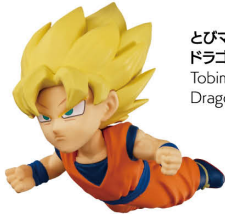
とびマス ドラゴンボール Tobimas Dragon Ball