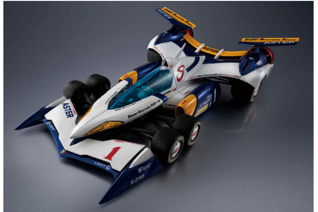
ヴァリアブルアクション Hi-SPEC 新世紀GPXサイバーフォーミュラ11 スーパーアスラダAKF-11 -35th Anniversary Color Edition- Variable Action Hi-SPEC Future GPX Cyber Formula 11 Super Asurada AKF-11 -35th Anniversary Color Edition-