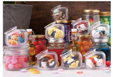
MEGA CAT PROJECT ワンピース おやすみニャンピースニャン!編 MEGA CAT PROJECT ONE PIECE Good Night NyanPieceNyan!