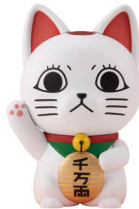
オルカティック ソフビコレクション TVアニメ『ダンダダン』 ターボババ(招き猫) Occultic Sofubi collection TV Anime “DAN DA DAN” Turbo Granny (Fortune Cat)