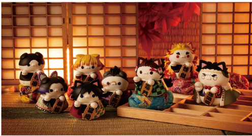
MEGA CAT PROJECT 鬼滅の刃 鬼滅の刃ニャンコ 招き猫ver. 各 MEGA CAT PROJECT Demon Slayer: Kimetsu no Yaiba Demon Slayer Fortune Cats ver. 01

我们正在面向全球推广高品质玩具模型产品。 如原创手办“MEGA CAT PROJECT”系列， 以及“P.O.P”和“Variable Action”等 面向年轻消费群体的中价位手办系列。