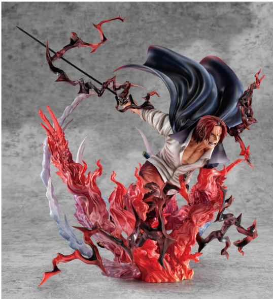
Portrait.Of.Pirates ワンピース “SA-MAXIMUM” 赤髪海賊団 大頭 赤髪のシャンクス 神遊。 Portrait.Of.Pirates ONE PIECE “SA-MAXIMUM” Leader of Red Hair Pirates Red-Haired Shanks Kamusari