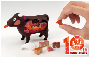
一頭買い!!特選 焼肉パズル -ウシ- KAITAI BEEF PUZZLE