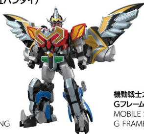
機動戦士ガンダム GフレームFA 07 MOBILE SUIT GUNDAM G FRAME FA 07

SMP[SHOKUGAN MODELING PROJECT] 魔神合体 マジキング SMP[SHOKUGAN MODELING PROJECT] MAJIN GATTAI MAGI KING