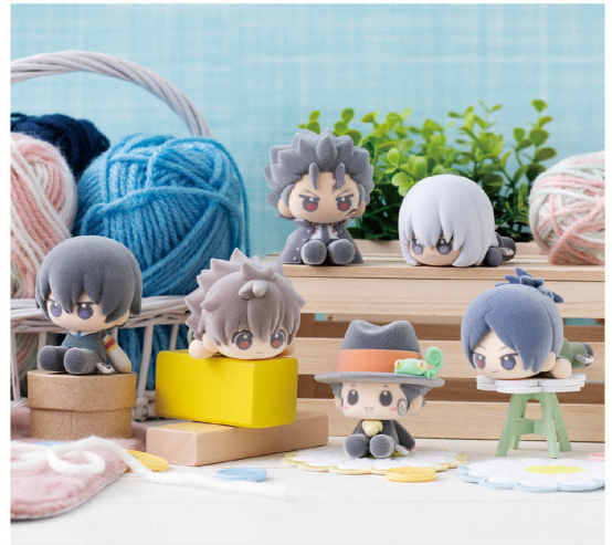
ぬいっば 家庭教師ヒットマンREBORN! Nuippo: Katekyo Hitman Reborn!