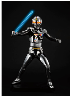
Ultimate Article 宇宙刑事ギャバン Ultimate Article Space Sheriff Gavan