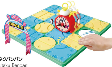
チクタクバンバン Chikutaku Banban