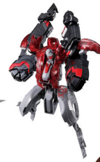
カプセルガーディアン3 CAPSULE GUARDIAN3