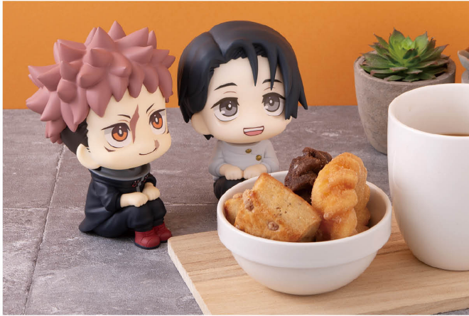
るかつぶ 呪術廻戦 虎杖悠仁 ver.2 Lookup: Jujutsu Kaisen - Yuji Itadori ver.2 (左) るかつぶ 呪術廻戦 乙骨憂太 ver.2 Lookup: Jujutsu Kaisen - Yuta Okkotsu ver.2 (右)