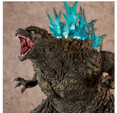
UA Monsters ゴジラ(2023)銀座強襲時イメーカラーVer. UA Monsters GODZILLA (2023) Image Color of Attacking Ginza Ver.