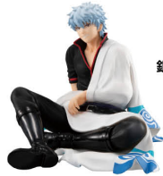
G.E.M.シリーズ 銀魂 てのひら銀さん G.E.M. series Gintama Palm Size Gin san